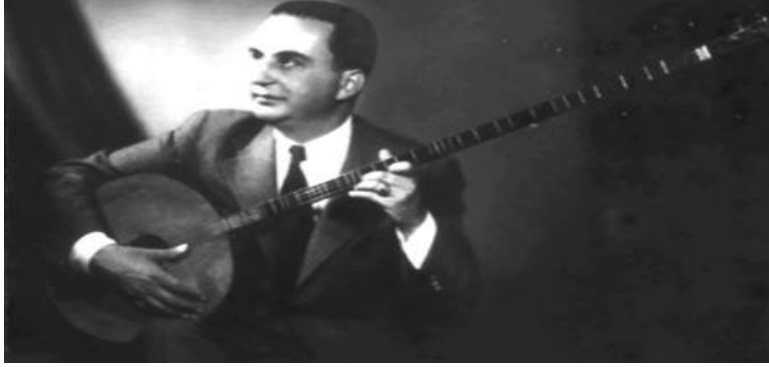
Münir Nurettin Selçuk