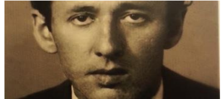
Orhan Veli Kanık