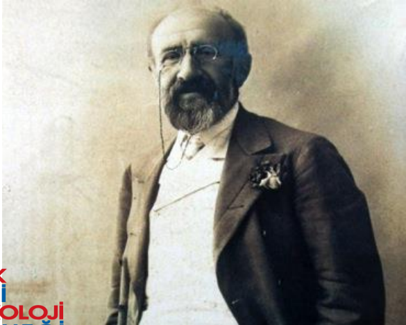
Osman Hamdi Bey